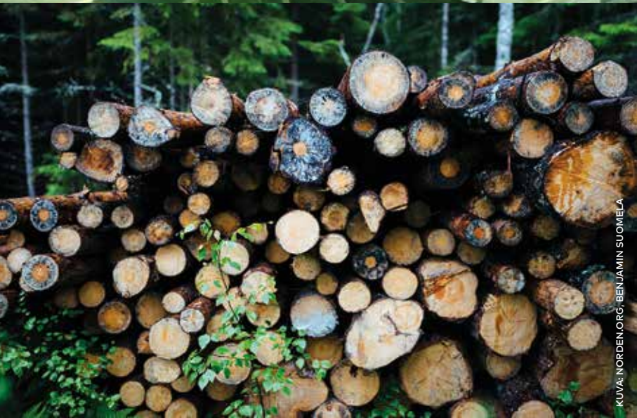
KUVA: NORDEN.ORG, BENJAMIN SUOMIOLA