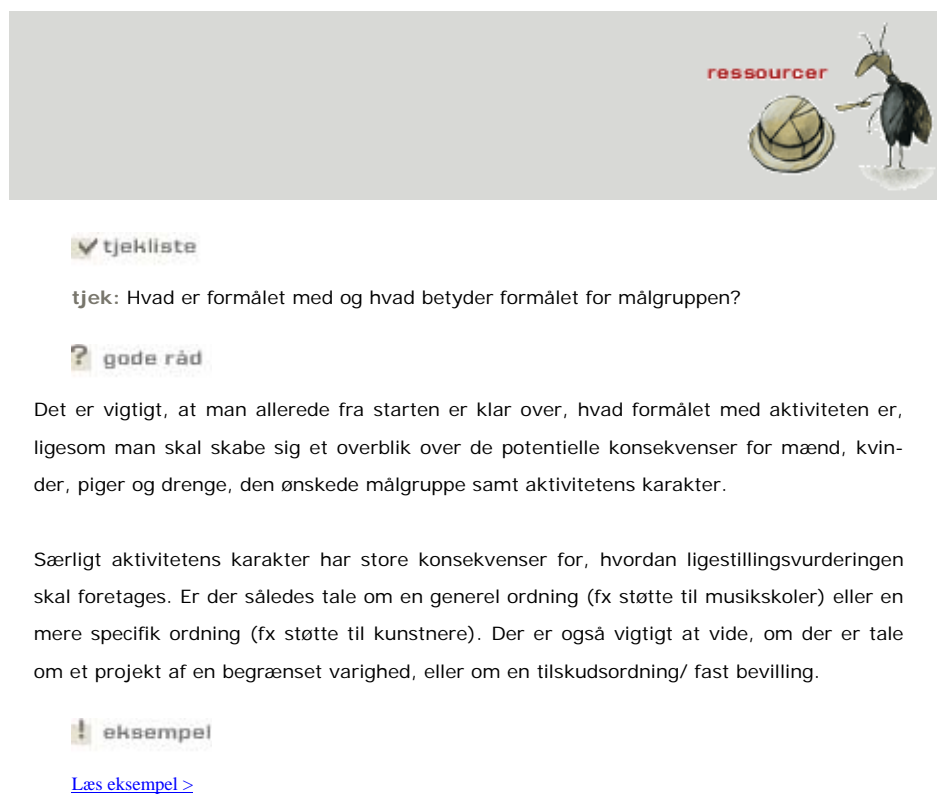
Figur 2: Eksempel fra hjemmesiden for værktøjet om ligestillingsvurderinger af resourcefordelingen.

Opbygningen er den samme som for de tre andre værktøjer, der er udviklet under det tværministerielle kønsmainstreamingprojekt: Data, lovgivning og kampagner. Opbygningen følger en slags FAQ 4 , hvor der først stilles et typisk spørgsmål, derefter kommer et forslag til en løsning af problemstillingen og til sidst understreges problemstillingen i et eksempel. For eksempel: