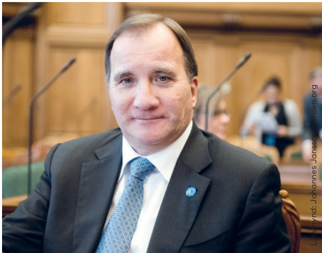
Stefan Löfven forsætisráðherra