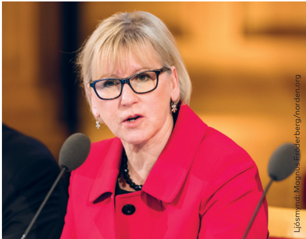
Margot Wallström, utanríkisráðherra og norrænn samstarfsráðherra