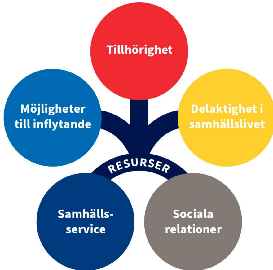
Figur 3: Fem aspekter av ungas sociala inkludering.

Vilka ska med? Ungas sociala inkludering i Sverige (2019), s. 22.