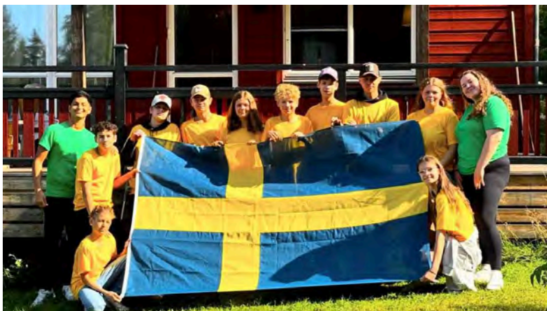
En nordisk sommerleir for døve barn ble arrangert i Sverige med støtte fra Støtteordningen.

Tilskuddsordningen er en del av Nordisk program for samarbeid om funksjonshinderspørsmål 2023–2027 . Målet med tilskuddsordningen er å gi organisasjoner i Norden og Baltikum muligheter til å møtes, samarbeide og utvikle felles aktiviteter. Tildelingskriteriet er at aktivitetene fremmer interessene til og samfunnsspørsmål som berører personer med funksjonsnedsettelse eller kroniske sykdommer.