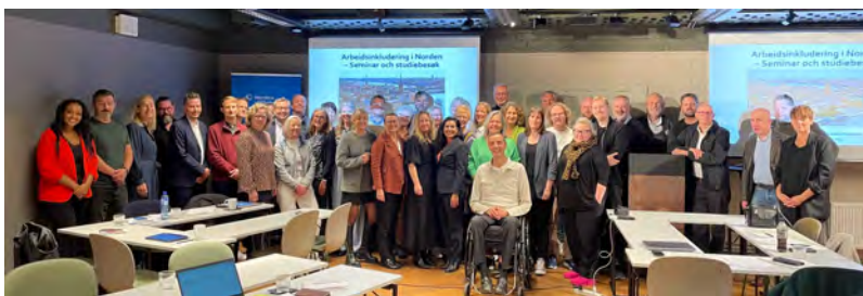
Deltakere på seminar og studiebesøk om inkluderende arbeidsliv i de nordiske landene.