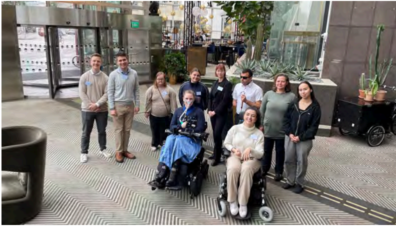
Deltakerne på Nordic Youth Disability Summit 2024 representerer nasjonale organisasjoner for unge med nedsatt funksjonsevne.

«For å styrke barne- og ungdomsperspektivet i nordisk samarbeid om funksjonshinderspørsmål skal det årlig arrangeres et ekspertmøte med representanter fra interesseorganisasjoner for unge med funksjonsnedsettelse.» - fra Nordisk program for samarbeid om funksjonshinderspørsmål 2023–2027