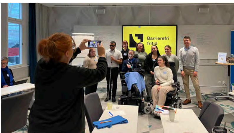
På workshopen om barrierefri fritid deltok en reporter fra Sveriges Radio Malmöhus, som intervjuet deltakerne.

Barrierer kan være både sosiale og fysiske. Sosiale barrierer kan være holdninger og fordommer i samfunnet eller mangel på kunnskap om funksjonsnedsettelse, mens fysiske barrierer kan inkludere behovet for personlig assistanse eller manglende universell utforming.