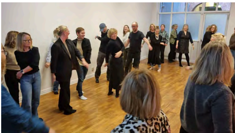
Det nordiske kurstilbudet og arrangementene utfyller de nasjonale utdanningene på døvblindområdet.

Den nordiske døvblinde-virksomheten ved Nordens velferdssenter skal bidra til implementeringen av FN-konvensjonen om rettighetene til personer med kombinert syns- og hørselsnedsettelse (UNCRPD), som er en særlig sårbar og marginalisert gruppe i samfunnet. Målgruppen er liten i hvert enkelt land, og det nordiske samarbeidet har som mål å utvikle kunnskap på døvblindefeltet. Oppdraget omfatter opplæring, utviklingsarbeid, koordinering av grenseoverskridende arbeid mellom virksomheter og organisasjoner på døvblinde-feltet i Norden. Samarbeidet retter seg primært mot praktikere, myndigheter og forskningsmiljøer og består av prosjekter, arbeidsgrupper, seminarer og nettverk.