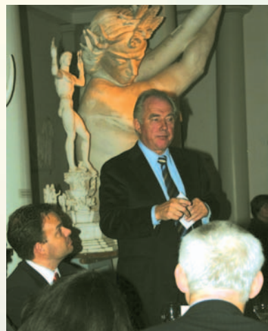
Generalsekretær Halldór Ásgrímsson snakker om betydningen av det Nordiske samarbeidet. Til venstre en lyttende Sven Otto Littorin.