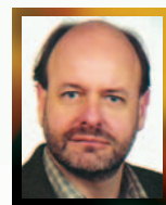
Av: Björn Lindahl

Två av dem, den latinska; där kvinnorna står för det mesta av välfärdstjänsterna, och den kontinentala; med ett starkt anställningsskydd, sackade efter i den ekonomiska tillväxten.