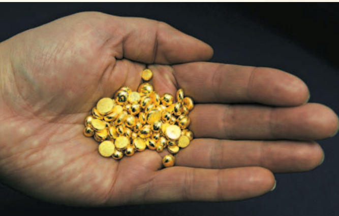
Lapplands guld – nuggets från Kittilä gruva. Fem ton per år ska det bli.

De dystra nyheterna fortsätter att strömma in från pappers- och massaindustrin som lägger ner enhet efter enhet i Finland. I höstmörkret lyser ändå ett ljus från en annan industrigren, gruvnäringen som åter etablerat sig i Finland på bred front. Men den globala finanskrisen gav en kalldusch.