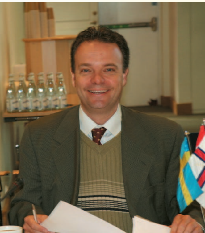
Arbetsmarknadsminister Sven Otto Littorin leder ministermøtet

Claus Hjorth Frederiksen forteller om den danske ordningen med amnesti. Amnestiet innebærer at førtidspensjonerte som prøver å jobbe, men ikke klarer det, får tilbake pensjonen uten at behovet prøves på nytt. Forutsetningen for diskusjonen er at når førtitalistene går i pensjon trenger landene arbeidskraft.