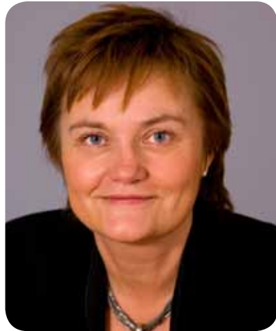
Jens Stoltenberg forsætisráðherra